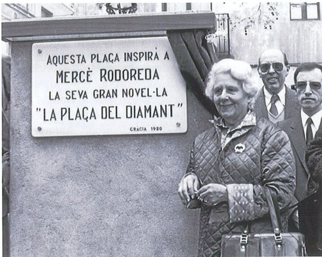
Mercè Rodoreda en un homenatge a la plaça del Diamant, al barri de Gràcia de Barcelona, 1980

L a plaça del Diamant de Mercè Rodoreda és la novel·la que hem llegit durant el primer trimestre del curs en l'assignatura d'Història d'Espanya, en 2n-B de Batxillerat de l'IES Pare Arques de Cocentaina. Està ambientada en la Barcelona de la primera meitat del segle XX. Amb Natàlia, la «Colometa», veurem l'arribada de la Segona República, la Guerra Civil i la difícil postguerra, però des de la visió íntima i silenciosa d'una dona treballadora.